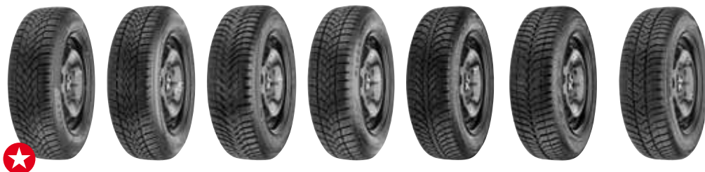
zimní pneumatiky, rozměr 175/65 R14