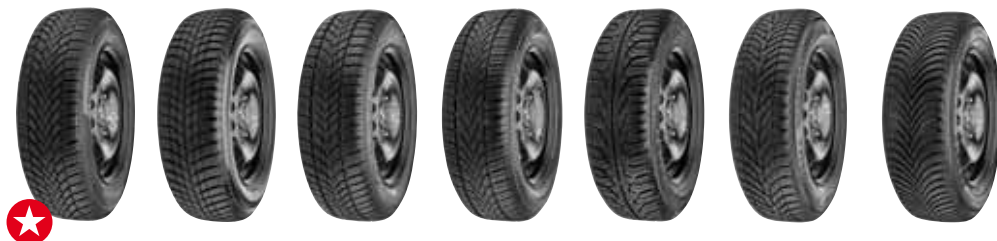
zimní pneumatiky, rozměr 195/65 R15