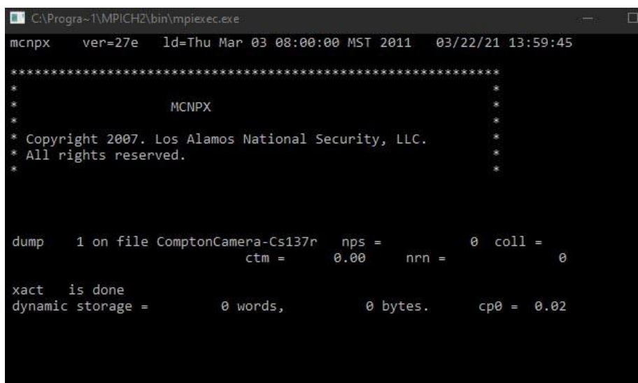
Obrázek 1: Dialogové okno s Monte Carlo výpočtem v software MCNP.